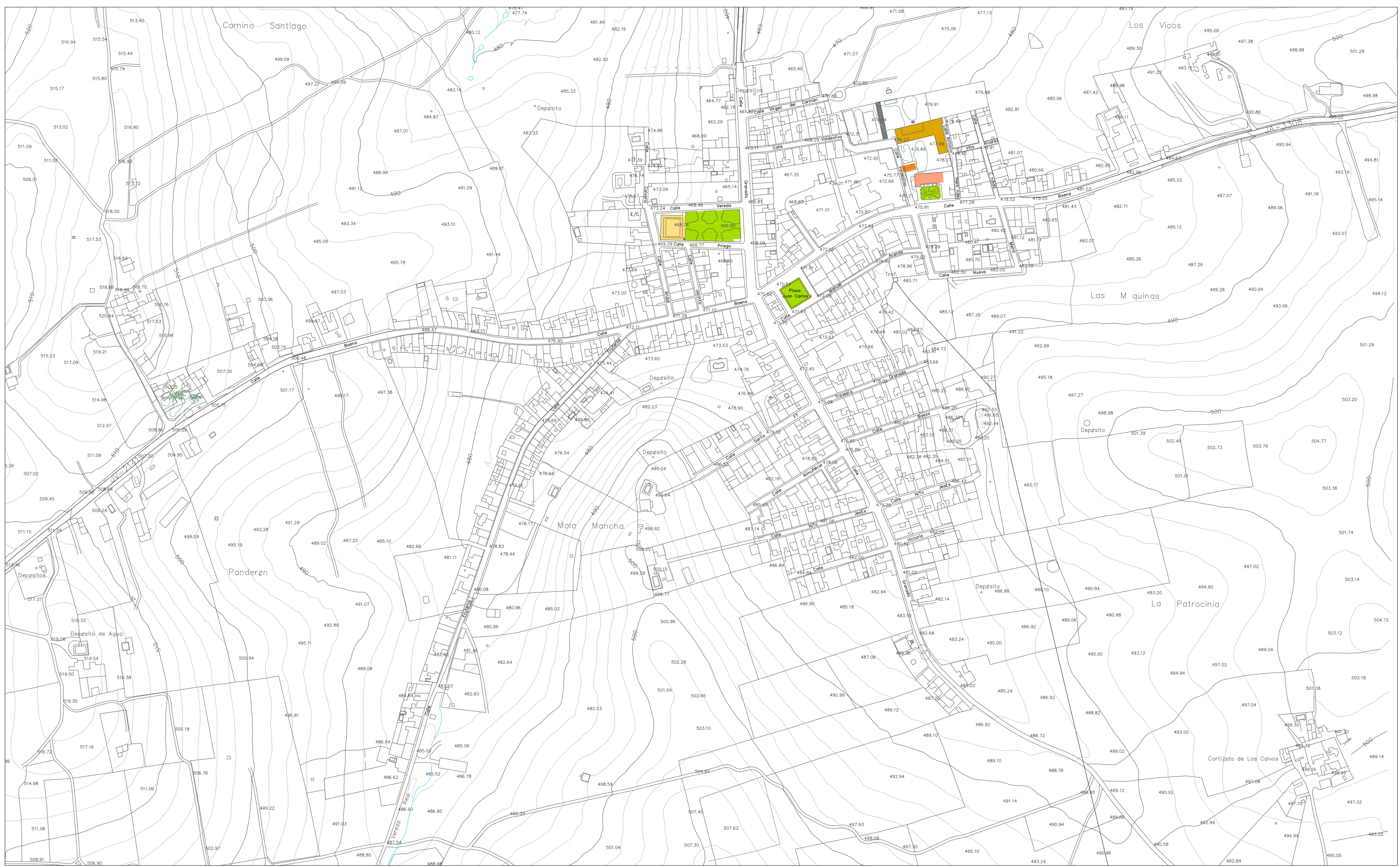
MONTE LOPE ÁLVAREZ