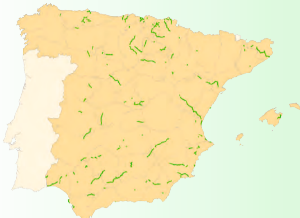
Mapa de las Vías Verdes de España

La Red de Vías Verdes de Andalucía está formada por 26 itinerarios, que suman una longitud cercana a los 600 km. La construcción, mantenimiento y promoción de estas infraestructuras es fruto de las inversiones de la Administración Central, la Junta de Andalucía y las administraciones locales. Además, se sigue promoviendo el desarrollo de nuevas Vías Verdes sobre cerca de 1.000 km de trazados ferroviarios en desuso existentes en Andalucía.